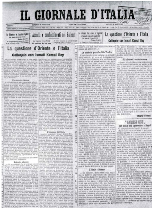
Intervistë e Ismail Qemal bej Vlorës për gazetën italiane «Il Giornale d'Italia» dhënë Vittorio Vettorit, më 16 gusht 1903